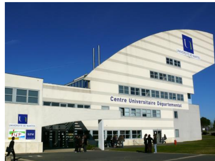
Centre Universitaire Départemental La Roche-sur-Yon