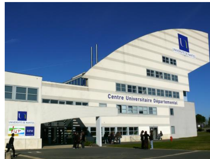
Centre Universitaire Départemental La Roche-sur-Yon