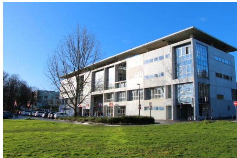
Faculté des langues et cultures étrangères Nantes